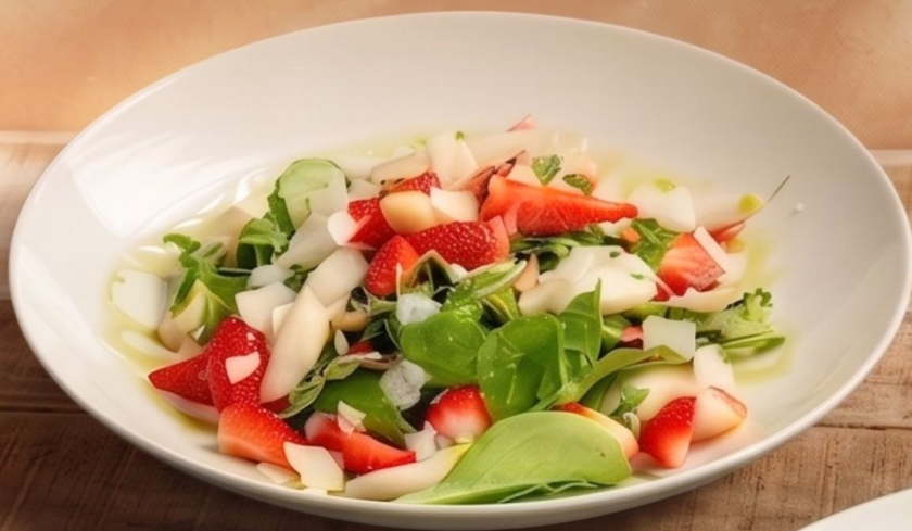
Salat „Spring Garden“ a.k

Babyleaf-Salat mit Erdbeeren, frischem Spargel und hausgemachtem Dressing, dazu Sauerteigbrot.