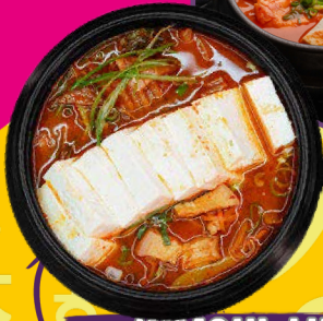
KIMCHI JJIGAE (김치찌개)