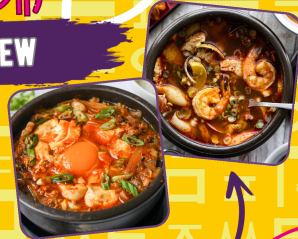
SUNDUBU JJIGAE (순두부찌개)

GEFÜLLT MIT ZARTEM, GEZUPFTEM RINDFLEISCH, SOWIE EINER FÜLLE AN GEMÜSE WIE LAUCH, MUNGOBOHNENSPROSSEN, PILZEN UND DEN CHARAKTERISTISCHEN FARNSPROSSEN (GOSARI). LOADED WITH TENDER, PULLED BEEF AND A GENEROUS MIX OF VEGETABLES, INCLUDING LEEKS, BEAN SPROUTS, MUSHROOMS, AND THE CHARACTERISTIC FERNBRAKE (GOSARI).